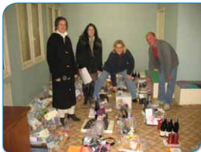
L'équipe du Sou de l'Ecole Publique de Clérieux